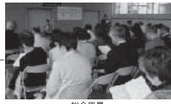
新入会員入会式風景

新入会員 入会式：今年度卒業の57回生の272名を代表して5名がそれぞれ、盛大な拍手がおくられた。