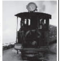
もくもくと煙を上げて