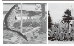
立看 1位 衣装 1位