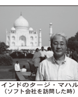
インドのタージ・マハル (ソフト会社を訪問した時)

Kとしています。 「仕事関係だけじゃないん ですか?」 「ええ、公私混合です。 例えば、ハイブリッド車 などはほとんどがソフト屋 の域です。ここを伸ばすに はやはり「人間」、人材育 成じゃないかと思いま すね。」