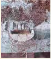
アンゼラム・キーフアーはドイツの現代画家、1968年に修学旅行に行ったあの二条城にウクライナ、オデッサの惨状を重ねる

キーフアーの壁にポチョンキン、乳母車 あのおデッサの、二条城になり コラージュは、キーフアー作の乳母車 思い起こせしあの母と石段 母の手を離れてつ乳母車 赤子乗せのまま 落下してゆく 子を抱きて石段登る母の眼ぞ 銃弾の雨容赦なく降る キーフアーのラーが羽ばたくその時にこそ、 戦が終わる朝日が昇る