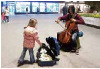
セルビアの首都ベオグラードでの路上ライブ

父は高校生の私に言った。 現在40歳。チェロ奏者として生きているが、幼少から音楽に親しんだわけでもない。音大を出たわけでもない。ただ音楽に関わろうと、手当たり次第にやっていたら幸運にもそうなった。高校生の頃には想像もつかないが、16歳で始めたチェロが人生の伴侶だ。