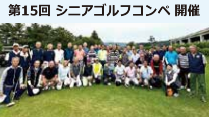
第15回 シニアゴルフコンペ 開催

2025年5月29日(木)、快晴の伊豆大仁CCで恒例の江南同窓会シニアコンペが開催されました。今回は、第15回記念大会で15回生から29回生までの総勢44名の参加で12組の賑やかなコンペとなりました。尚、第16回江南同窓会シニアコンペは、同じく伊豆大仁CCで来年の2026年5月28日(木)に開催致します。(14組抑えてあります) 各年次回生の皆さん、ご参加お願い致します。特に25回生、26回生、28回生、30回生の皆さんも横の連絡を取り合い是非ご参加をお待ちしております。